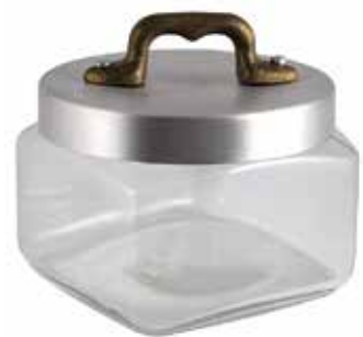
Ø cm. 10 h. cm. 7 lt. 0,5