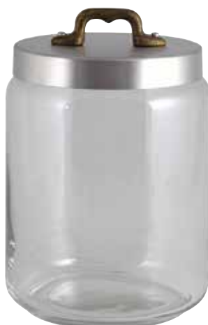
Ø cm. 11 h. cm. 18 lt. 2