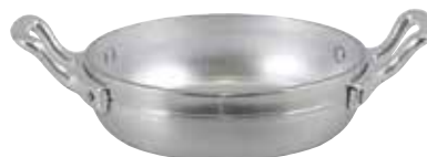
ART. 1566 AL

TEGAMINO 2 MANIGLIE FRYING PAN 2 HANDLES POÊLE A SAUTER 2 ANSES PFANNE 2 GRIFFE