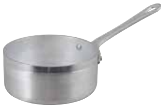
ART. 1561 AL

The evolution of our Le Piccole to fulfill the needs of a modern mood with an industrial style.