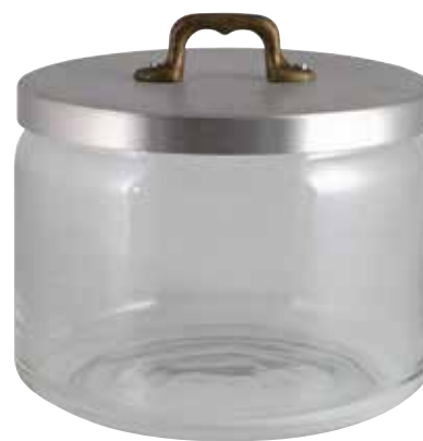
Ø cm. 18 h. cm. 14,5 lt. 2,4