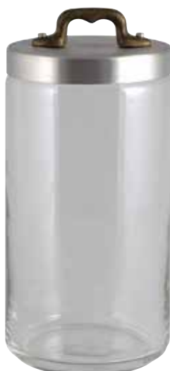
Ø cm. 10 h. cm. 20 lt. 1,5