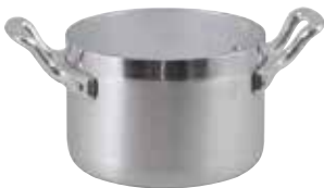
ART. 1565 AL

CASSERUOLINO ALTO 2 MANIGLIE DEEP SAUCE PAN 2 HANDLES CASSEROLE HAUTE 2 ANSES GEMÜSENTOPF 2 GRIFFE