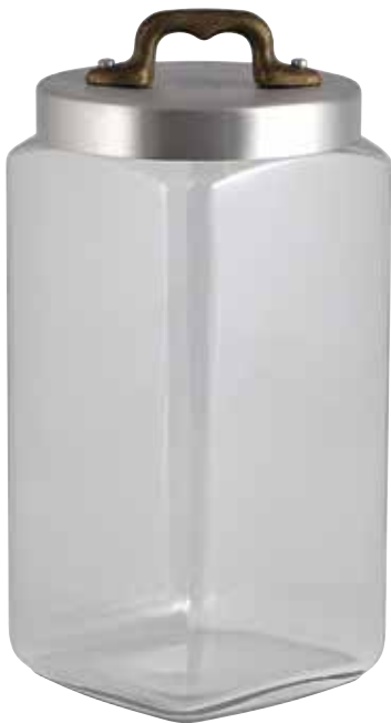
Ø cm. 10 h. cm. 19 lt. 1,5

GLASS STORAGE JARS WITH HERMETIC LID BOCAUX EN VERRE FERMETURE HERMETIQUE VORRATSDOSEN AUS GLAS MIT HERMETISCHEN DECKEL