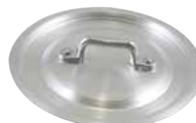
ART. 1580 AL