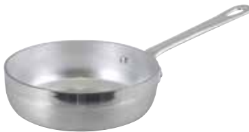
ART. 1563 AL

TEGAMINO 1 MANICO FRYING PAN 1 HANDLE POÊLE A SAUTER 1 MANCHE PFANNE 1 GRIFF