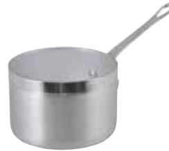
ART. 1562 AL

CASSERUOLINO ALTO 1 MANICO DEEP SAUCE PAN 1 HANDLE CASSEROLE HAUTE 1 MANCHE GEMÜSENTOPF 1 GRIFF