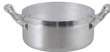
ART. 1564 AL

CASSERUOLINO 2 MANIGLIE SAUCE PAN 2 HANDLES CASSEROLE 2 ANSES BRATENTOPF 2 GRIFFE