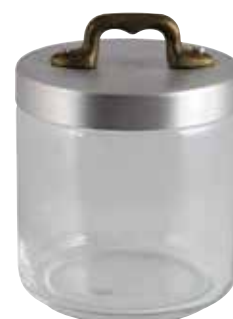
Ø cm. 10 h. cm. 11 lt. 0,75