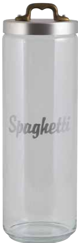
Ø cm. 10 h. cm. 30 SPAGHETTI lt. 2

GLASS STORAGE JARS WITH HERMETIC LID BOCAUX EN VERRE FERMETURE HERMETIQUE VORRATSDOSEN AUS GLAS MIT HERMETISCHEN DECKEL