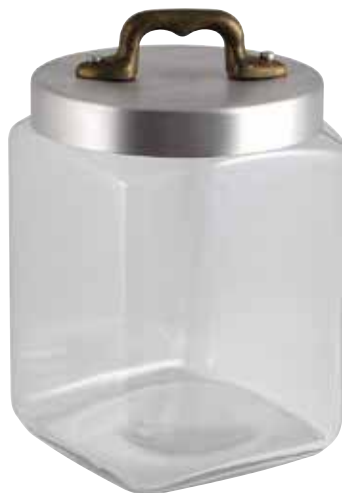
Ø cm. 10 h. cm. 13 lt. 1