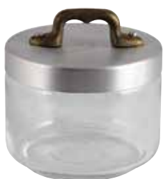
Ø cm. 10 h. cm. 8 lt. 0,50