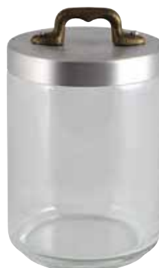
Ø cm. 10 h. cm. 14 lt. 1