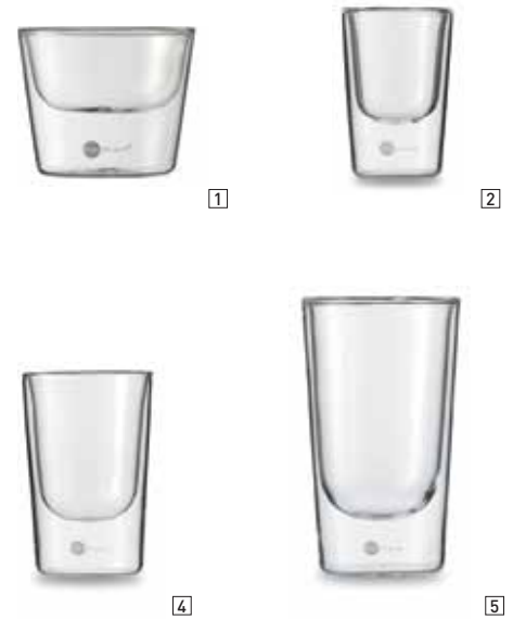
1 Schale PRIMO, 100 ml Bowl PRIMO, 3.4 oz